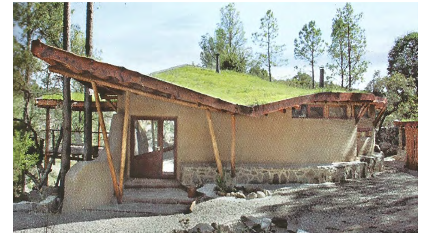
Fig. 1. Vivienda construida en tierra, ubicada en la provincia de Córdoba (Correia et. al., 2017)

Trabajar con técnicas que incorporan la tierra es más eficiente energéticamente puesto que en la producción de los elementos constitutivos se consume menos energía. Aquella necesaria para producir un material o un elemento constructivo se la considera como el Contenido Primario de Energía (CPE), y la tierra junto a otros productos naturales tienen un bajo CPE (Minke, n.d.). Según MacKillop, la energía necesaria para fabricar un adobe es de 13 kcal/unidad, un bloque de tierra-cemento,