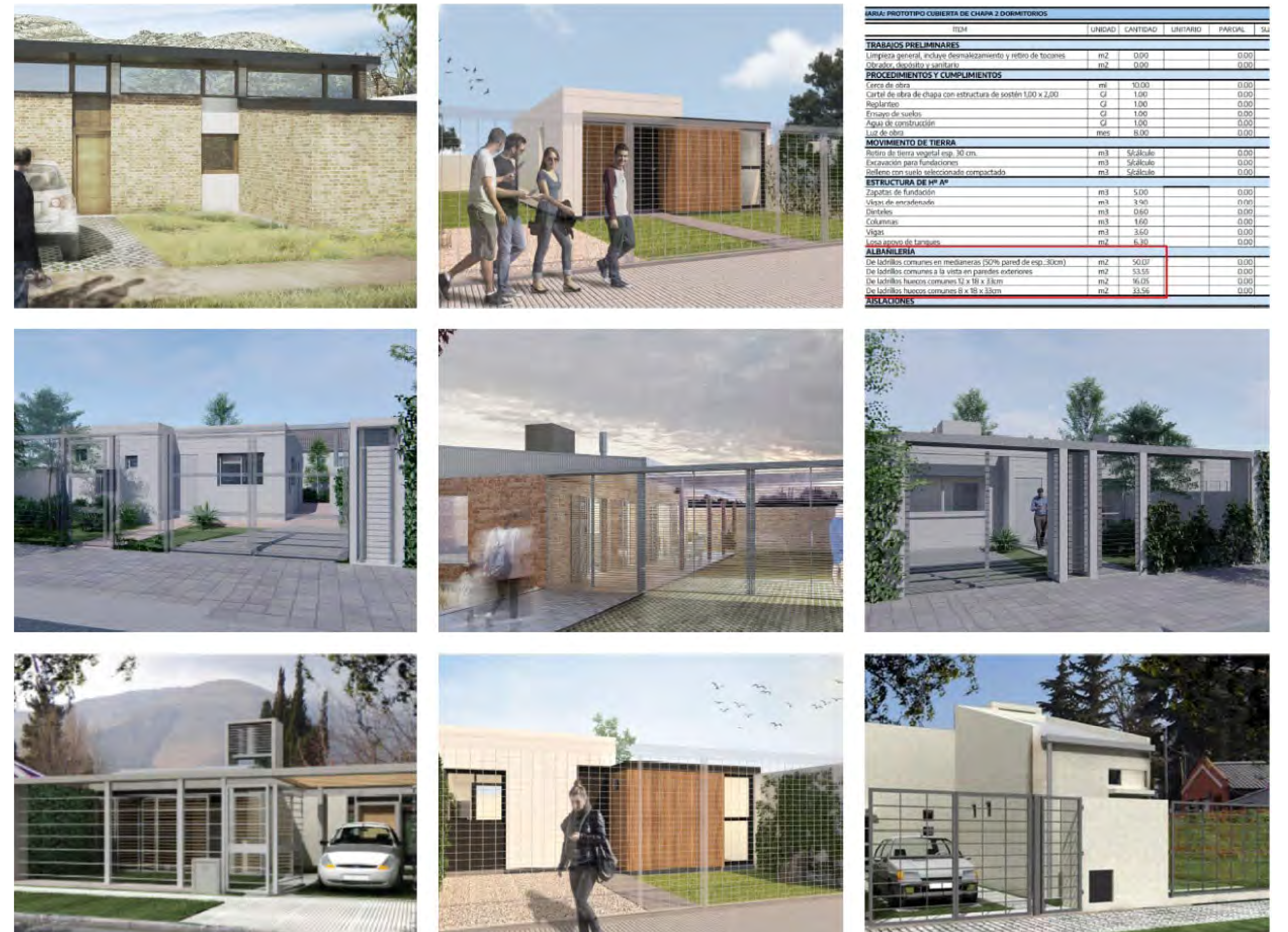
Fig. 2. Imágenes fotorrealistas de modelos de vivienda unifamiliar propuestas dentro del marco del Programa de Crédito Argentino (ProCreAr). Correia Et. Al., 2017

Recientemente el Gobierno Nacional creó el Registro de Prototipos de Construcciones Alternativas del Programa Procrear con el objetivo de incorporar al programa el desarrollo de viviendas no tradicionales, habilitando “la inscripción de nuevos modelos constructivos destinados a garantizar soluciones habitacionales” (Argentina, 2021). Si bien se sostiene que los nuevos prototipos “acortan los plazos de ejecución de las viviendas, mejoran la calidad de aislación térmica y se vinculan con el medio ambiente de una manera virtuosa porque la gran mayoría de estas tipologías tienen características constructivas que las hacen muy valiosas en ese sentido”, se entiende que se hace alusión a los sistemas industria-